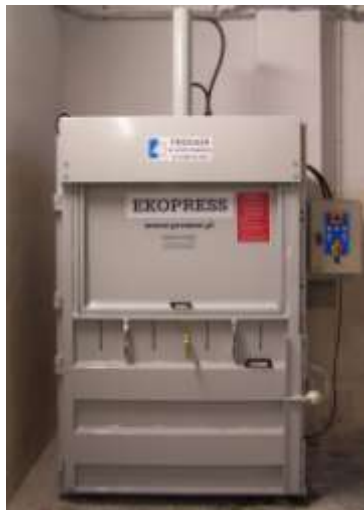
Drzwiczki wrzutowe : w opcji są rozsuwane