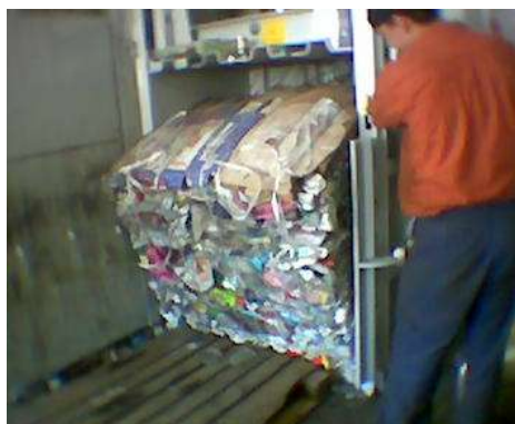
Automatyczny wyrzut beli na paletę