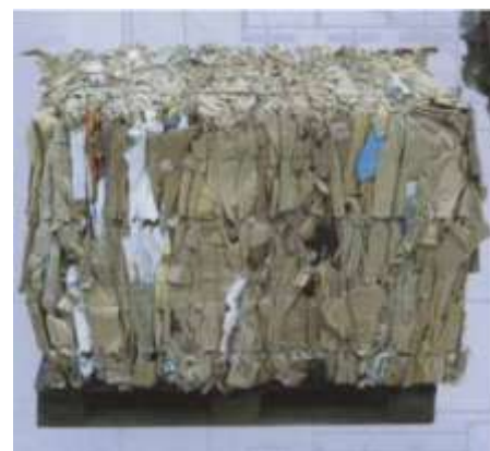
Gotowa bela o wielkości europalety