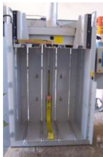
Wnętrze komory belownicy